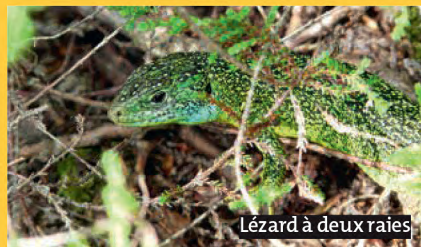
Lézard à deux raies