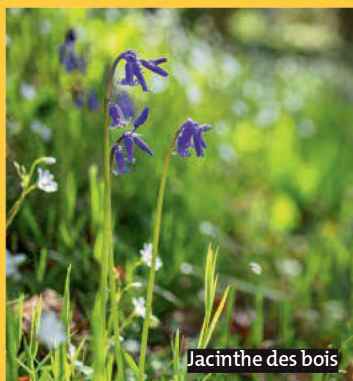
Jacinthe des bois