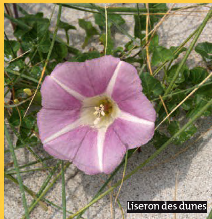
Liseron des dunes