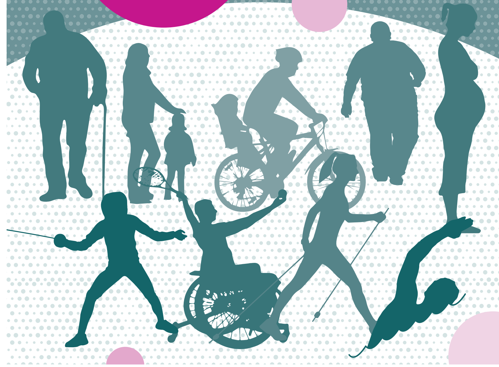
Juin 2022 - B-PT-0522-001 - Studio graphique du Département d'Ille-et-Vilaine.