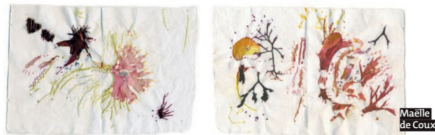
Maëlle de Coux

Ouverture tous publics les mardis et jeudis de 9 h 30 à 12 h 30 et de 13 h 30 à 17 h 30.