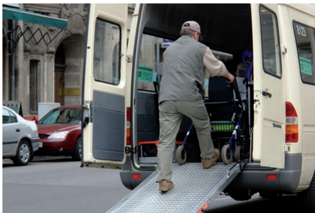
Faciliter l'autonomie est l'un des objectifs du Conseil général.