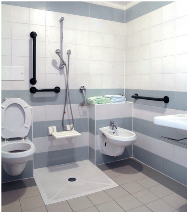
Le FDC peut aider à adapter une salle de bain au handicap.

C'est cette équipe d'évaluation qui élabore le plan personnalisé de compensation.