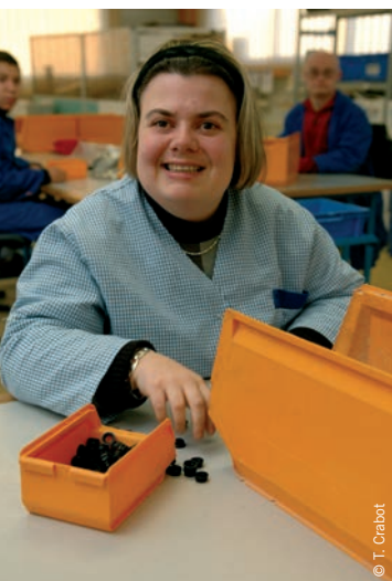
Travail encadré en atelier au foyer La Vaunoise à L'Hermitage.

L'admission dans un établissement dépend de l'orientation qui est prononcée par la Commission des droits et de l'autonomie (Maison départementale des personnes handicapées) et des places disponibles.