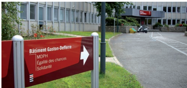
La MDPH, située dans le quartier de Beauregard à Rennes, accueille les personnes handicapées.