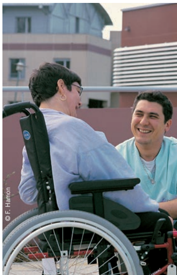
Le foyer d'accueil médicalisé de Saint-Méen-le-Grand accueille des adultes autistes ou polyhandicapés.

Les personnes accueillies ne peuvent pas exercer une activité professionnelle et ont besoin d'assistance pour la plupart des actes essentiels de la vie, d'une surveillance médicale et de soins constants.