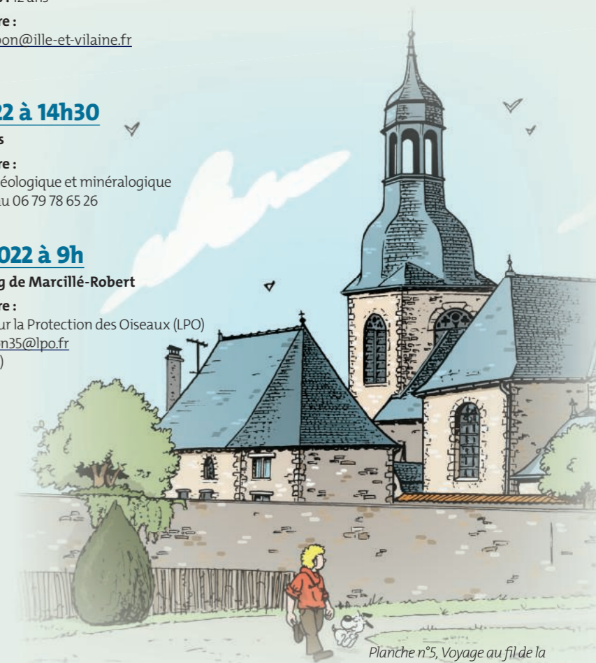
Planche n°5, Voyage au fil de la Seiche avec Vick et Vicky, Du Pertre à Marcillé-Robert. © Bruno Bertin