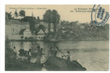
Carte postale « La pêche aux filets au début du XXe siècle.

Les témoignages seront présentés dans l'exposition.