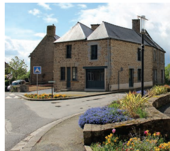
La réhabilitation de logements anciens, comme ici à Mellé, contribue à renforcer l'attractivité des centres-bourgs.

Une dotation satisfaisante en services et en équipements en Ille-et-Vilaine