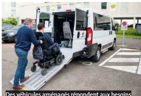
Des véhicules aménagés répondent aux besoins des élèves et étudiants.

Les conducteurs ne sont, à aucun moment, habilités à effectuer le transfert des élèves ou étudiants en situation de handicap de leur fauteuil roulant dans le véhicule (et vice-versa). Si l'élève ou l'étudiant ne peut faire seul son transfert, il sera alors pris en charge dans son fauteuil, dans un véhicule adapté.