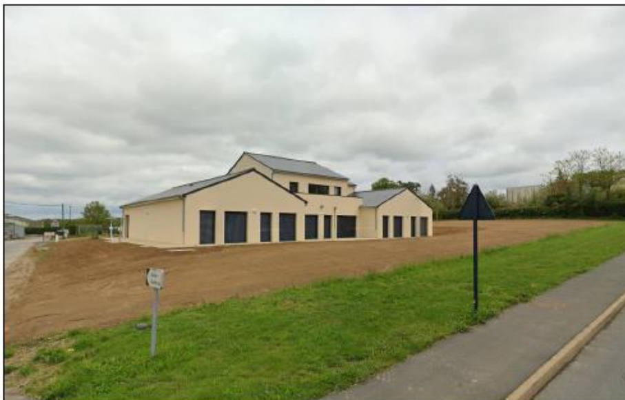
Parcelle AB 195

Une partie de la parcelle AB 195 (841 m 2 ) est destinée à l'aménagement paysager du secteur à vocation d'habitat, comme rédigé dans l'OAP. Les élus envisagent également d'y créer une liaison douce.