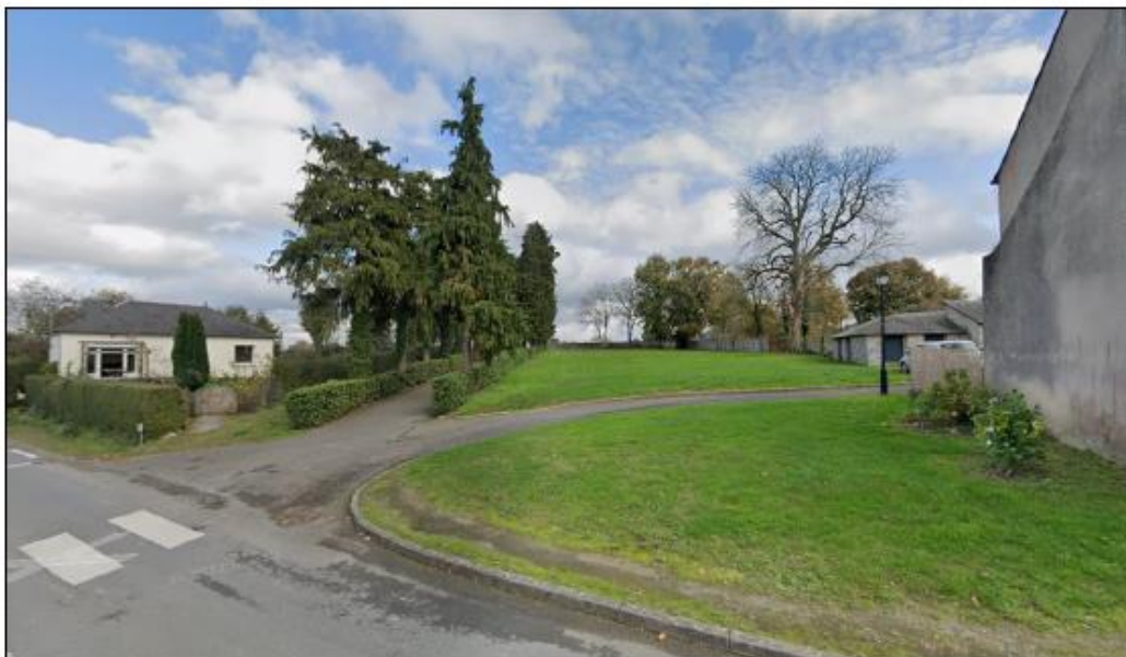
Parcelle AC 232

Sur une partie de la parcelle AC 232 (2 363 m 2 ) les élus envisagent la création d'un équipement destiné à la petite enfance ou aux activités périscolaires.