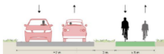
Aménagement principal : Piste bidirectionnelle en site propre de 3m de large

Enjeux : Desserte de Canon et de la Zone d'activités ; accessibilité aux commerces, équipements, établissements scolaires, zones d'emplois, connexion à l'ACI Sevailles / Orgerais.