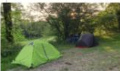
5 : La scierie, l'ancien camping