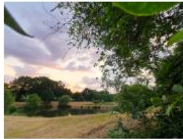
2 : Les lagunes :