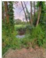
3 : La traversée de l'Ille