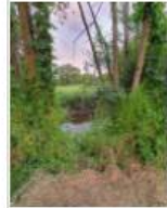
3 : La traversée de l'Ille