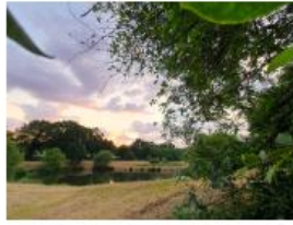
2 : Les lagunes :