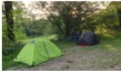
5 : La scierie, l'ancien camping